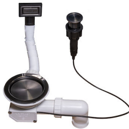
Automatischer Abfluss Space Push Gun Metal - PO 8407 120