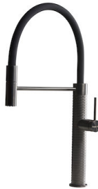
Mischbatterie Skin Gun Metal 8424 856