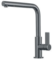
Mischbatterie Omega Gun Metal 8497 856