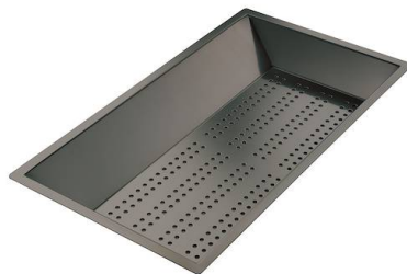
Perforierte Edelstahlwanne PVD Gun Metal 8151 006

* nur in Kombination mit dem Zubehör 8644 101